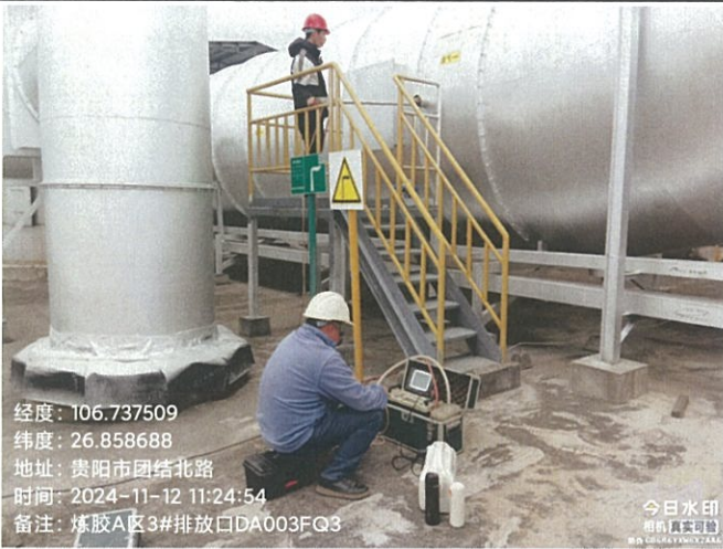
炼胶 A 区 3#排放口 DA003FQ3

2024 年 11 月 12 日至 11 月 13 日对贵州轮胎股份有限公司 2024 年第四季度自行监测项目进行现场采样。监测过程中对样品采取全程序空白样分析、运输空白样分析、实验室平行样分析、实验室空白样分析、质控样分析等质控措施。现场质控结果如表 6-1，平行双样分析精密度控制合格率情况如表 6-2，质控样或加标回收控制合格率情况如表 6-3。