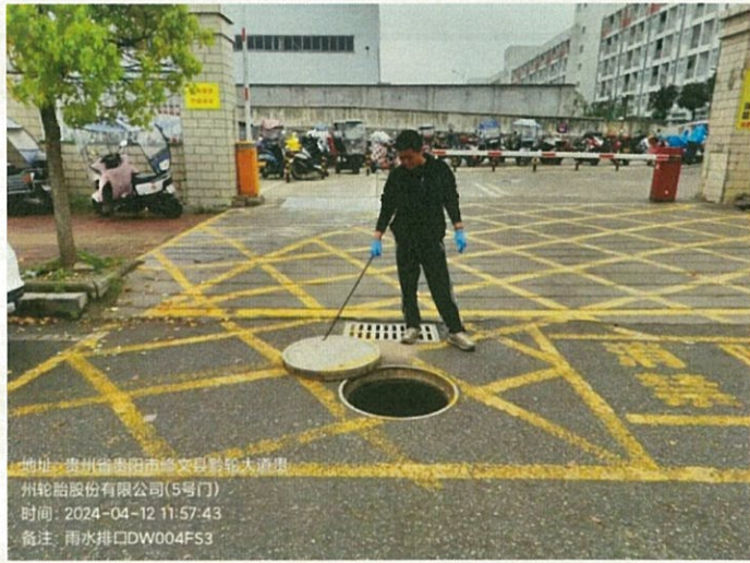
雨水排口 DW004FS3 (无水)