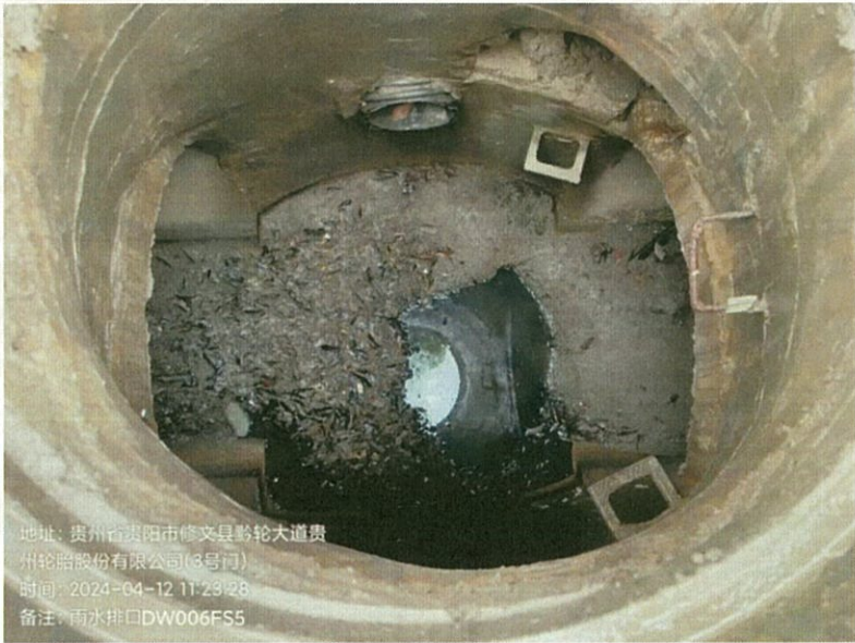
雨水排口 DW006FS5 (无水)