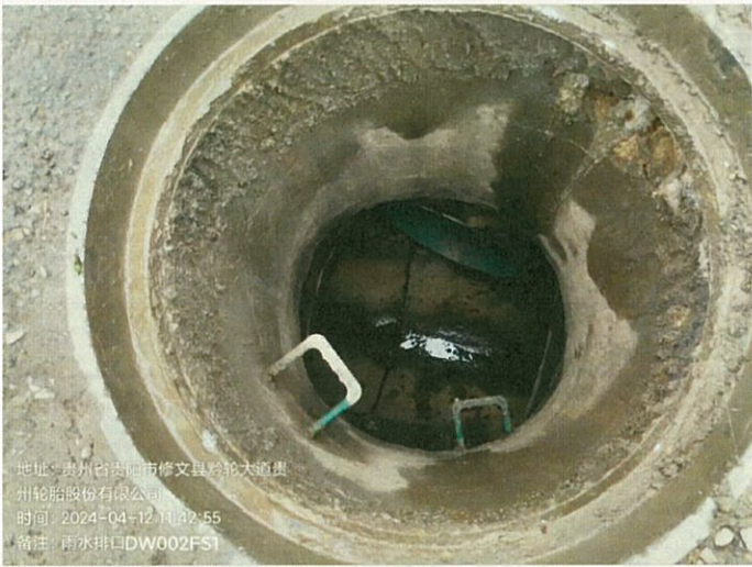
雨水排口 DW002FS1 (无水)