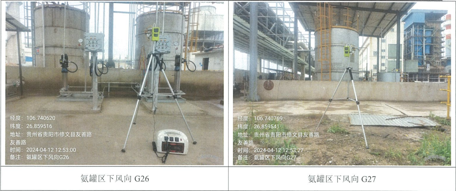
附：无组织监测点位示意图