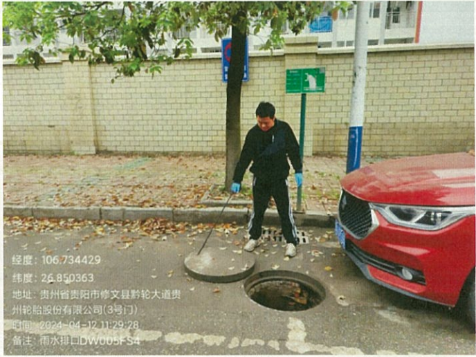
雨水排口 DW005FS4 (GPS)