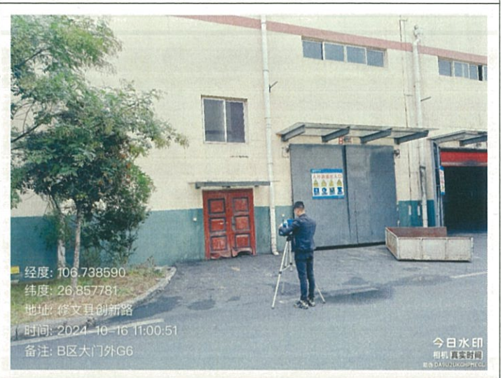
B 区大门外 G6 (GPS)