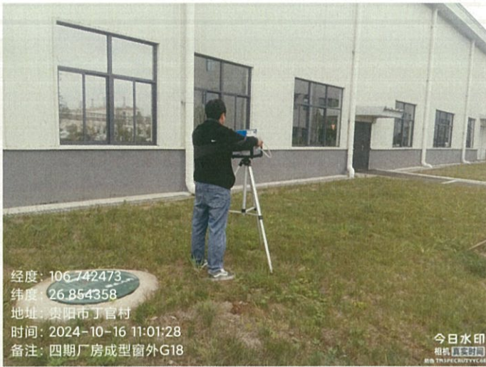
四期厂房成型窗外 G18（GPS）