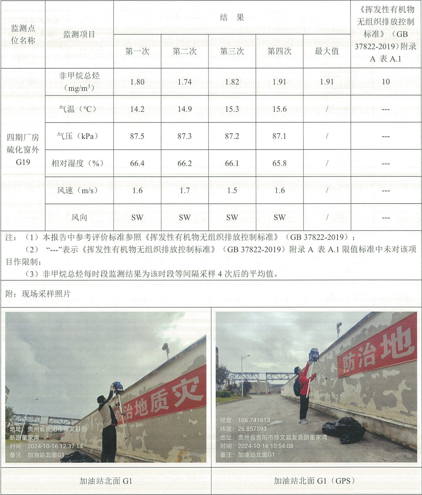
表 5-10 无组织废气（G19）监测结果