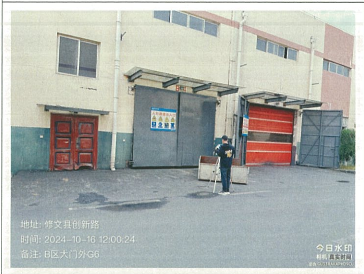
B 区大门外 G6