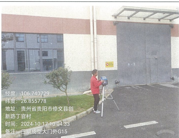
三期成型大门外 G15 (GPS)