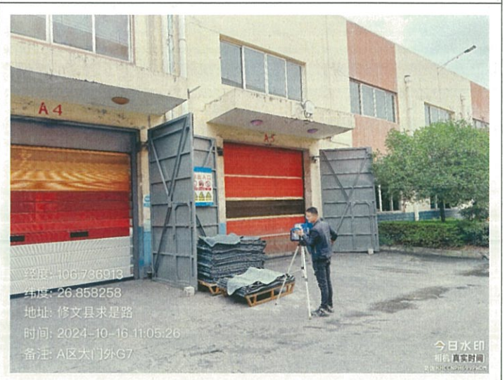
A 区大门外 G7 (GPS)