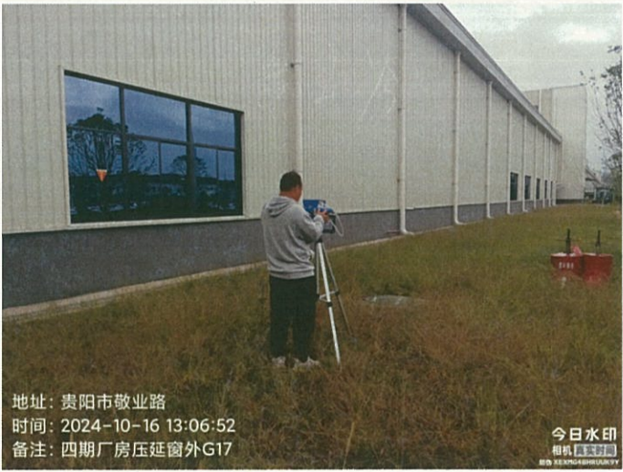
四期厂房压延窗外 G17