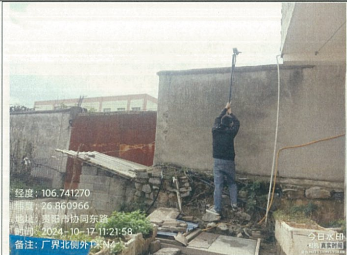
厂界北侧外 1 米 N4（昼）