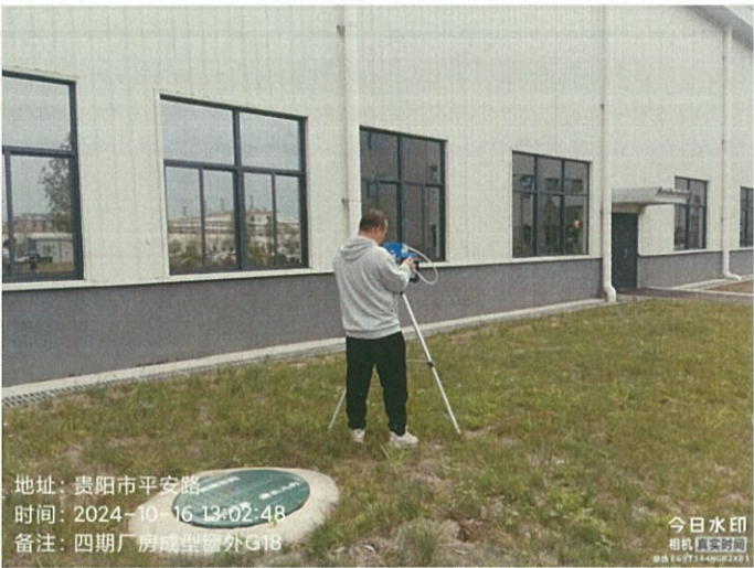
四期厂房成型窗外 G18