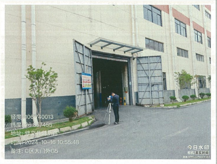
C 区大门外 G5 (GPS)