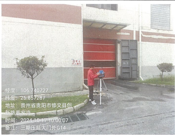
三期压延大门外 G14 (GPS)