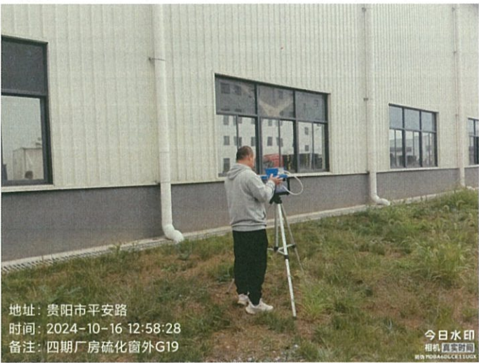
四期厂房硫化窗外 G19