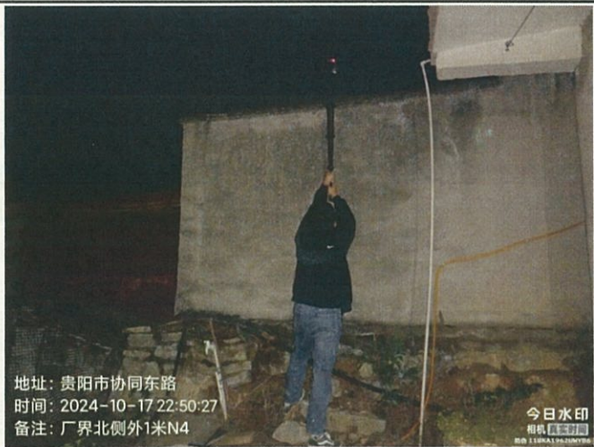
厂界北侧外 1 米 N4（夜）