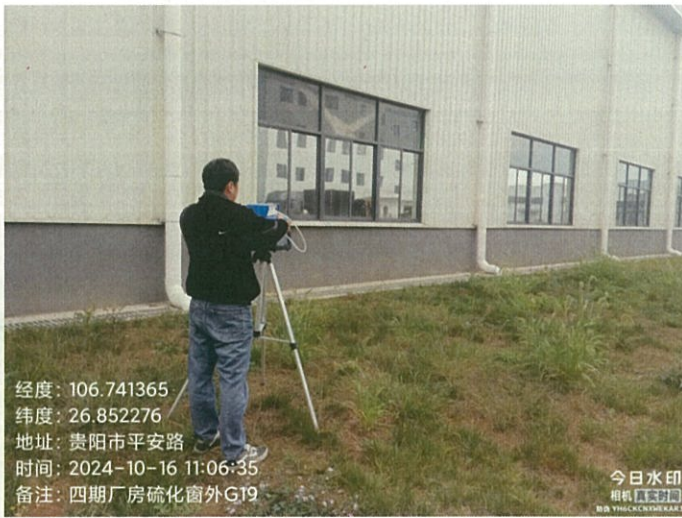
四期厂房硫化窗外 G19（GPS）