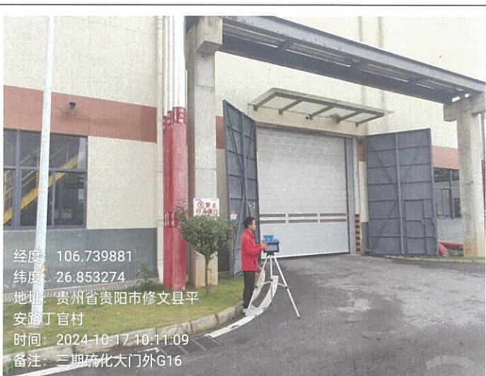
三期硫化大门外 G16 (GPS)