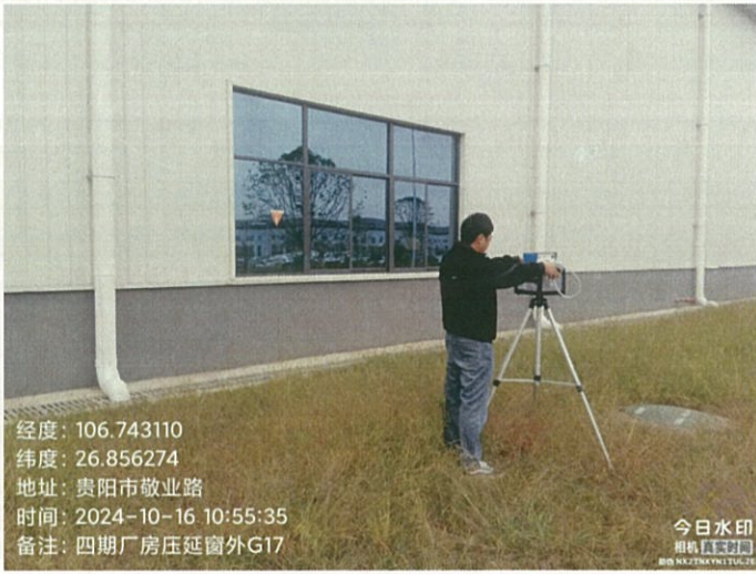
四期厂房压延窗外 G17（GPS）