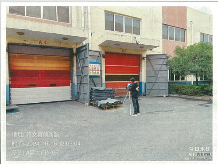
A 区大门外 G7