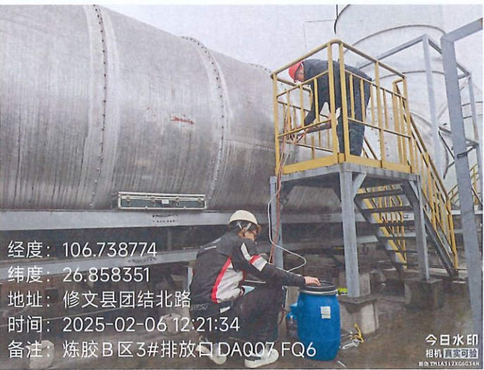
炼胶 B 区 3#排放口 DA007FQ6