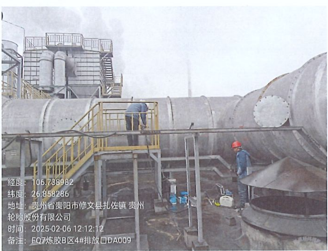
炼胶 B 区 4#排放口 DA009FQ7