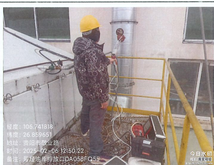
芳烃油库排放口 DA058FQ55 (GPS)