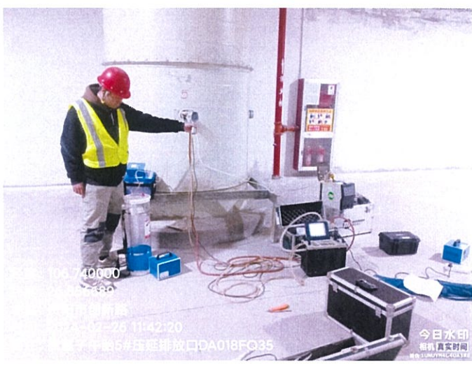
载重子午胎 5#压延排放口 DA018FQ35