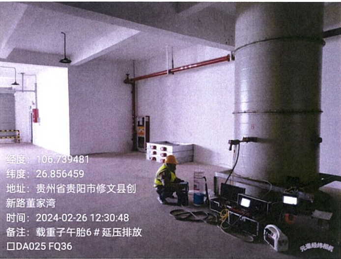
载重子午胎 6#压延排放口 DA025FQ36