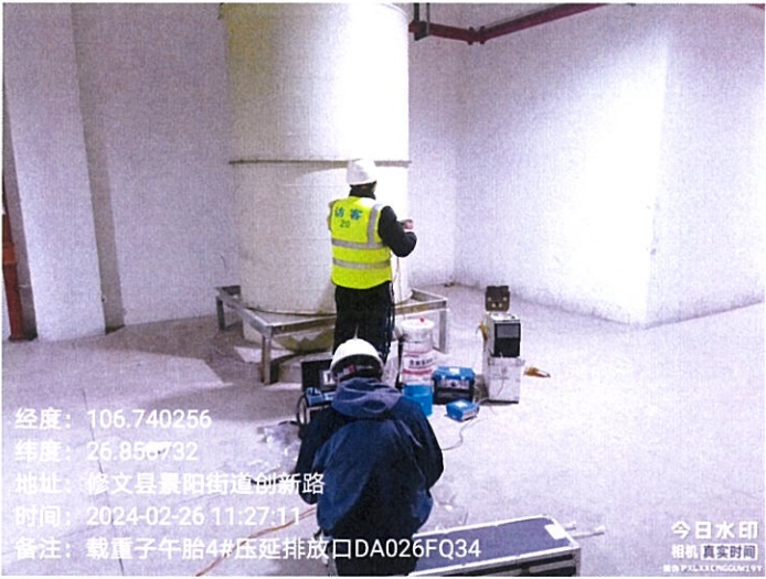
载重子午胎 4#压延排放口 DA026FQ34