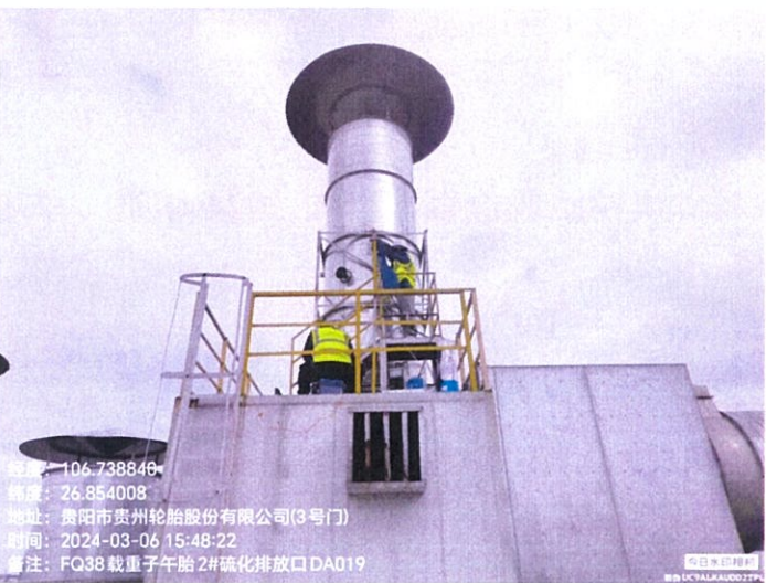
载重子午胎 2#硫化排放口 DA019FQ38