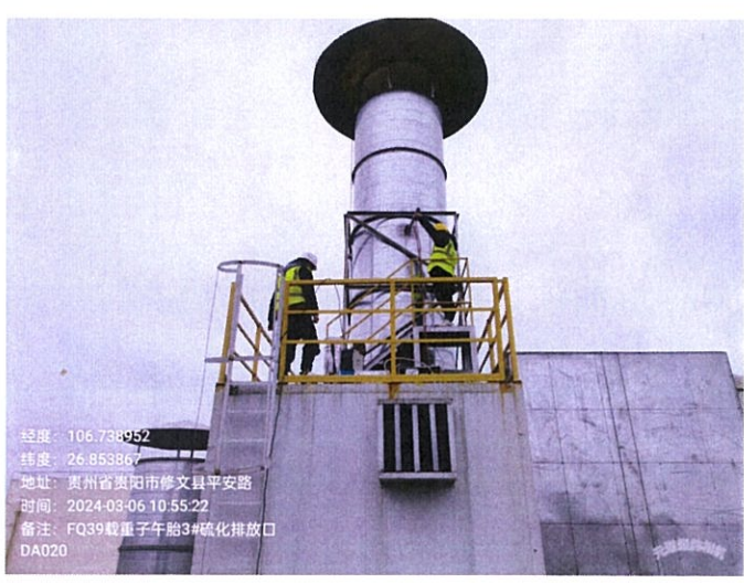
载重子午胎 3#硫化排放口 DA020FQ39