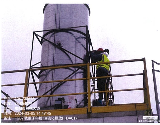
载重子午胎 1#硫化排放口 DA017FQ37