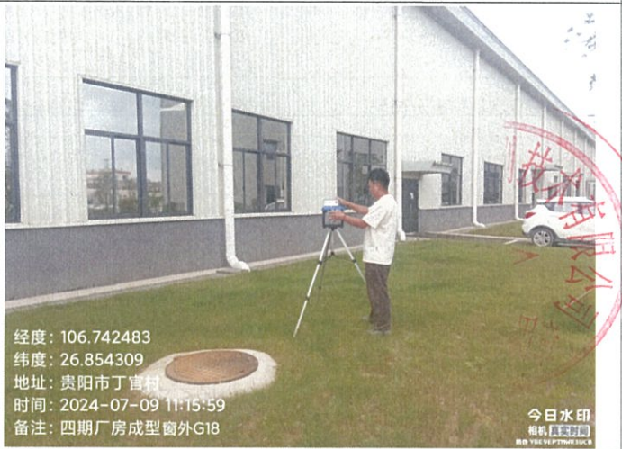
四期厂房成型窗外 G18