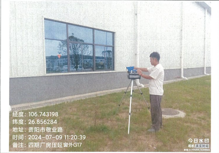
四期厂房压延窗外 G17