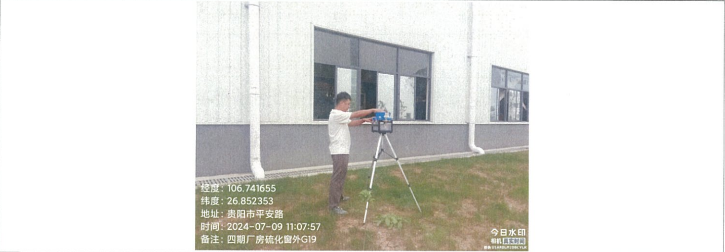
四期厂房硫化窗外 G19