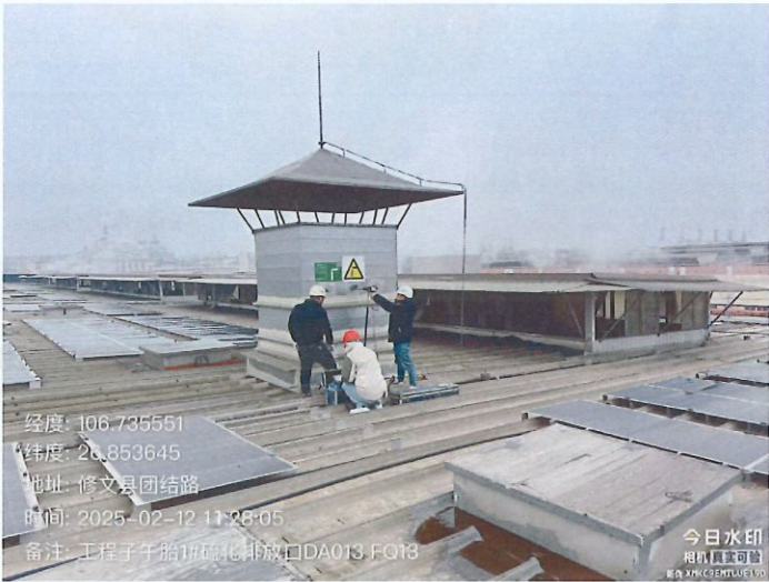
工程子午胎 1#硫化排放口 DA013FQ13