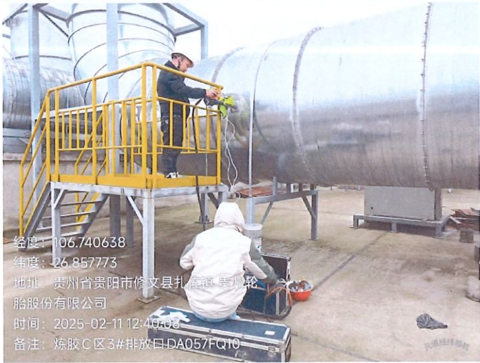
炼胶 C 区 3#排放口 DA057FQ10