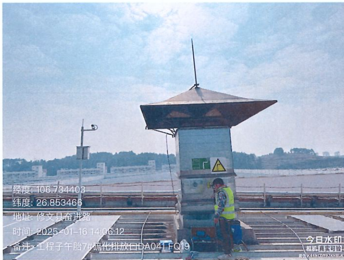
工程子午胎 7#硫化排放口 DA041FQ19（GPS）