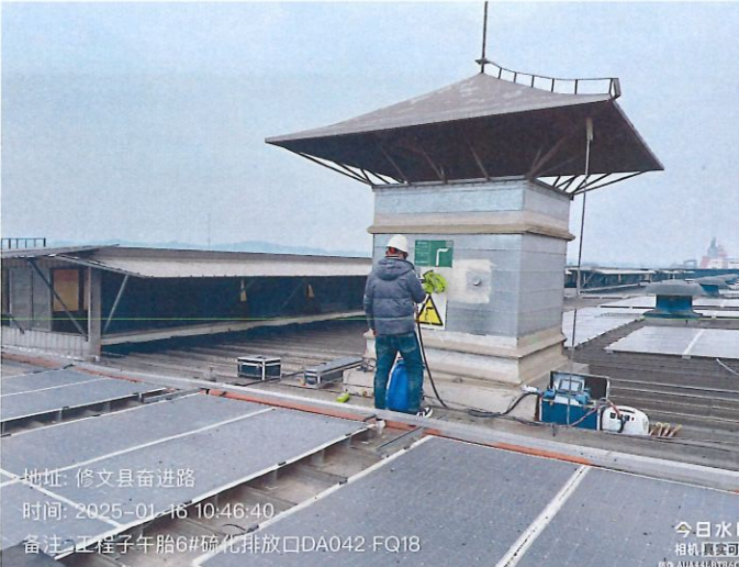
工程子午胎 6#硫化排放口 DA042FQ18