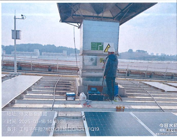
工程子午胎 7#硫化排放口 DA041FQ19（GPS）