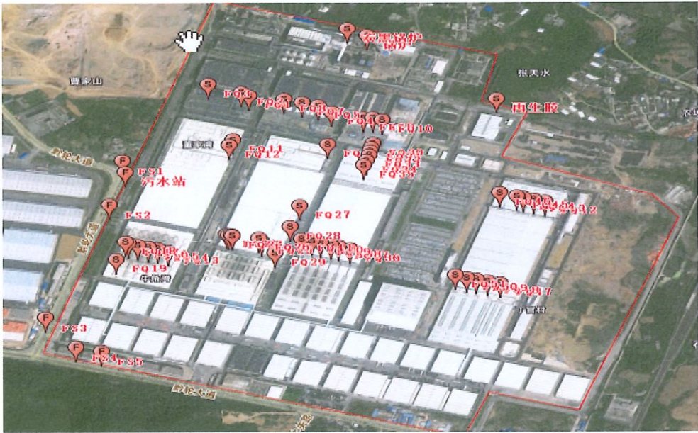
附：监测点位示意图

2025 年 2 月 11 日对贵州轮胎股份有限公司 2025 年第一季度自行监测项目进行现场采样，2025 年 2 月 11 日至 2 月 12 日进行监测分析。监测过程中对样品采取全程序空白样分析、实验室空白样分析等质控措施。现场质控结果如表 6-1。