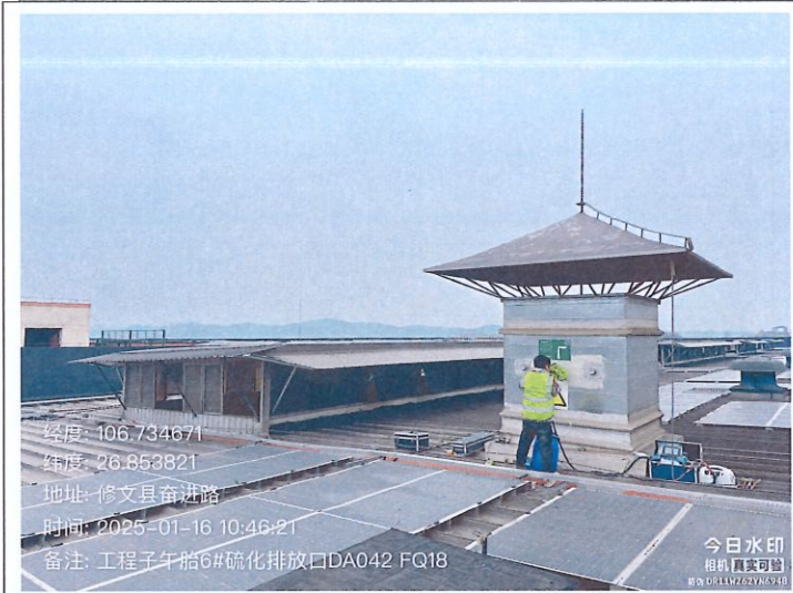
工程子午胎 6#硫化排放口 DA042FQ18（GPS）