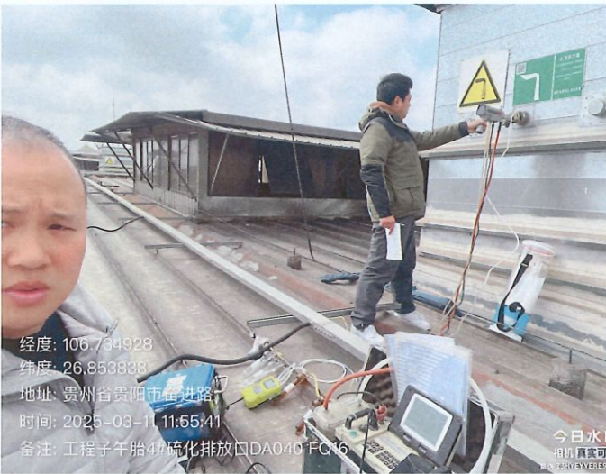
工程子午胎 4#硫化排放口 DA040FQ16