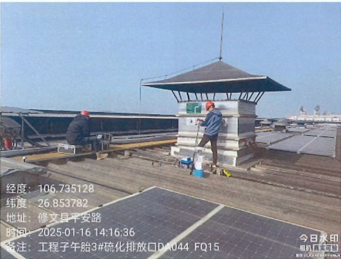
工程子午胎 3#硫化排放口 DA044FQ15