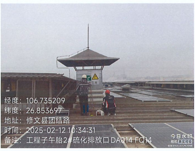
工程子午胎 2#硫化排放口 DA014FQ14