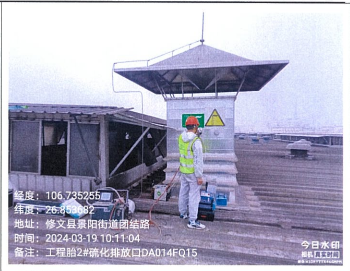
工程子午胎 2#硫化排放口 DA014FQ15