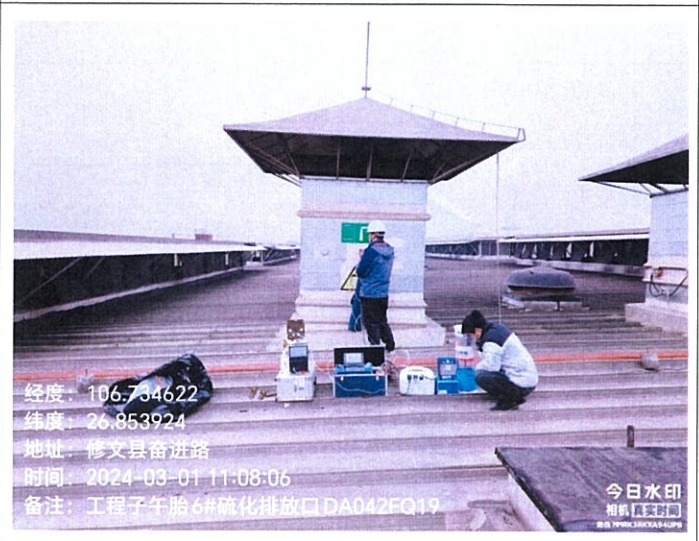
工程子午胎 6#硫化排放口 DA042FQ19