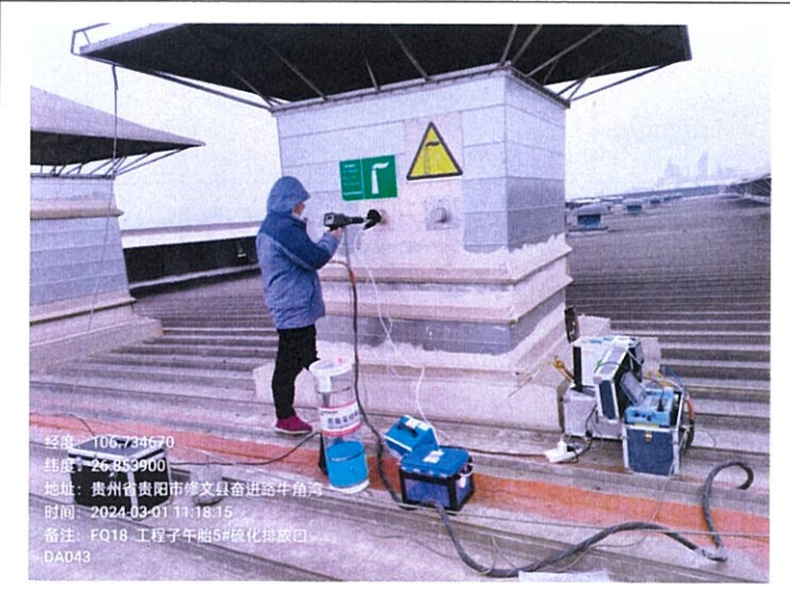
工程子午胎 5#硫化排放口 DA043FQ18