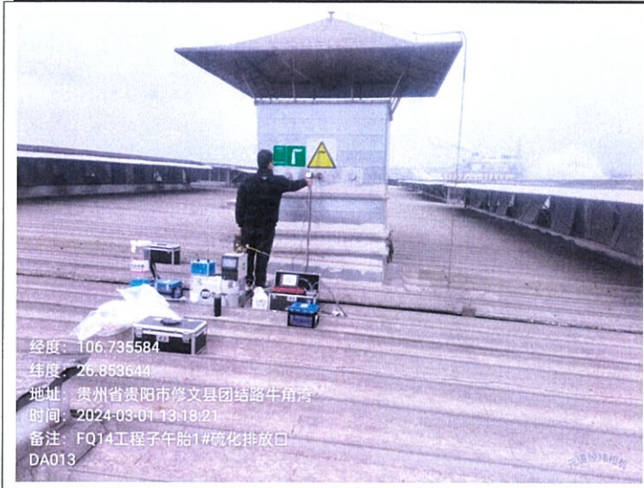
工程子午胎 1#硫化排放口 DA013FQ14