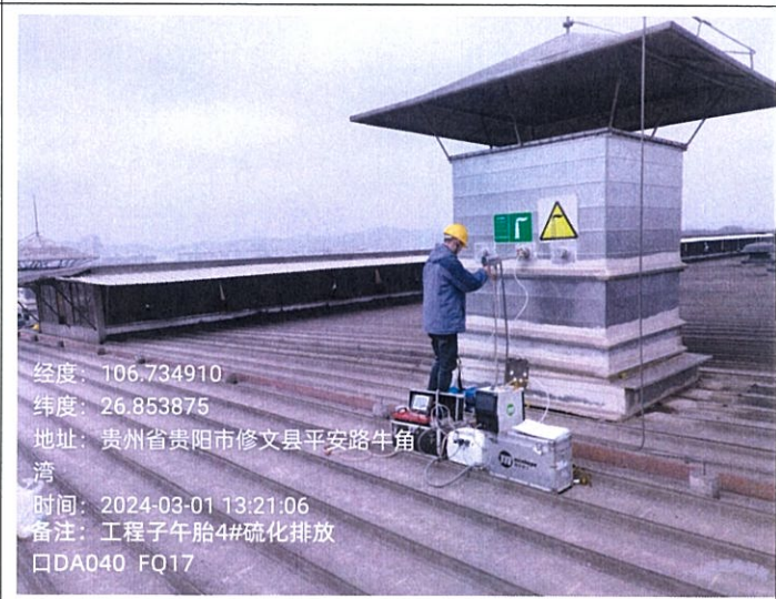
工程子午胎 4#硫化排放口 DA040FQ17