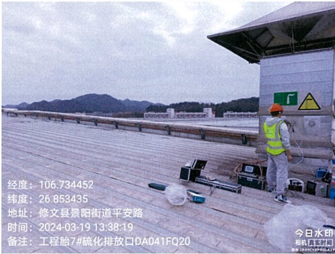
工程子午胎 7#硫化排放口 DA041FQ20

2024 年 3 月 1 日、3 月 6 日、3 月 19 日对贵州轮胎股份有限公司 2024 年第一季度自行检测项目进行现场采样。检测过程中对样品采取运输空白样分析、实验室平行样分析、实验室空白样分析、质控样分析等质控措施。现场质控结果如表 6-1，平行双样分析精密度控制合格率情况如表 6-2。