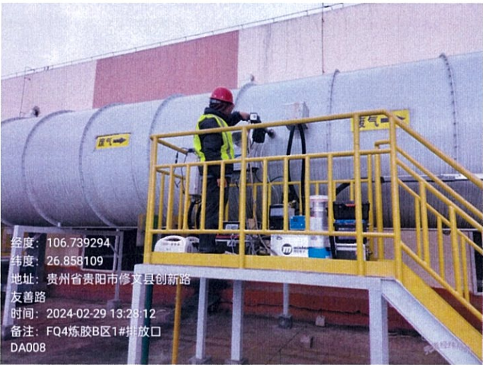
炼胶 B 区 1#排放口 DA008FQ4