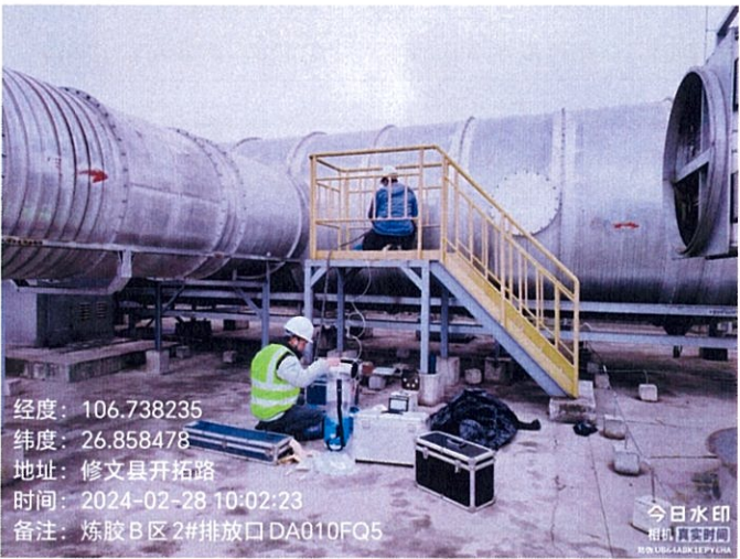
炼胶 B 区 2#排放口 DA010FQ5