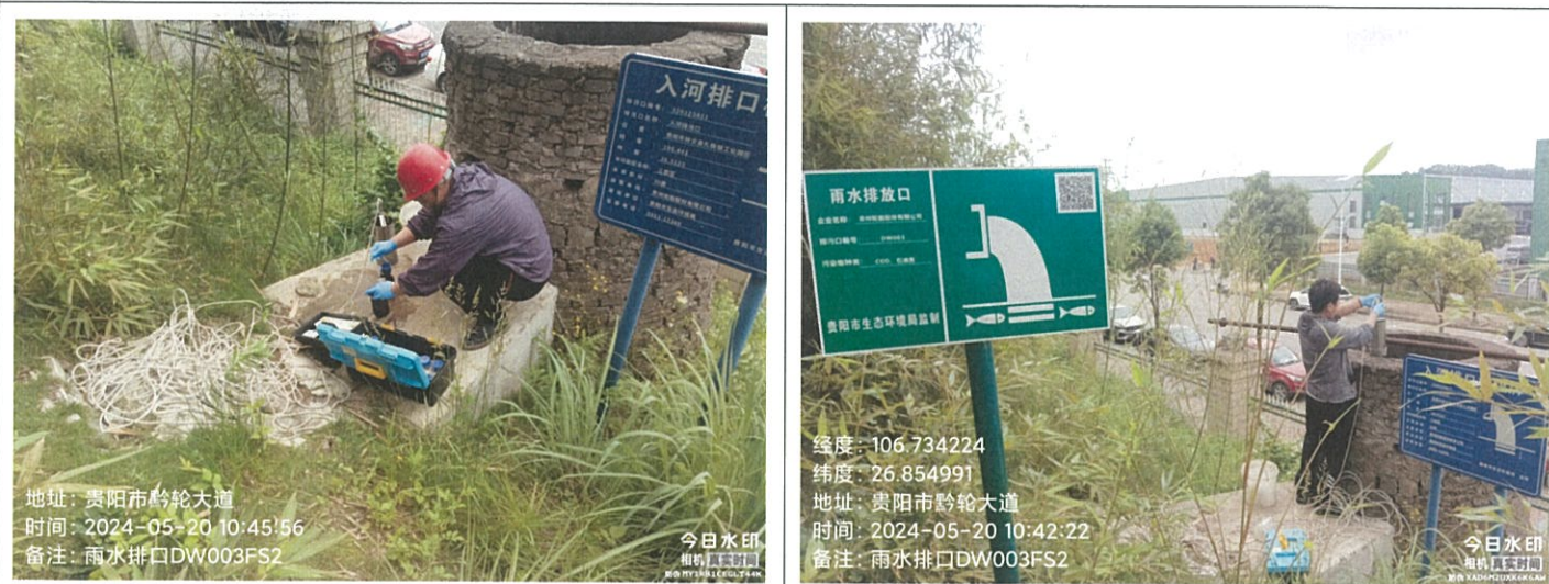
雨水排口 DW003FS2 雨水排口 DW003FS2（GPS）