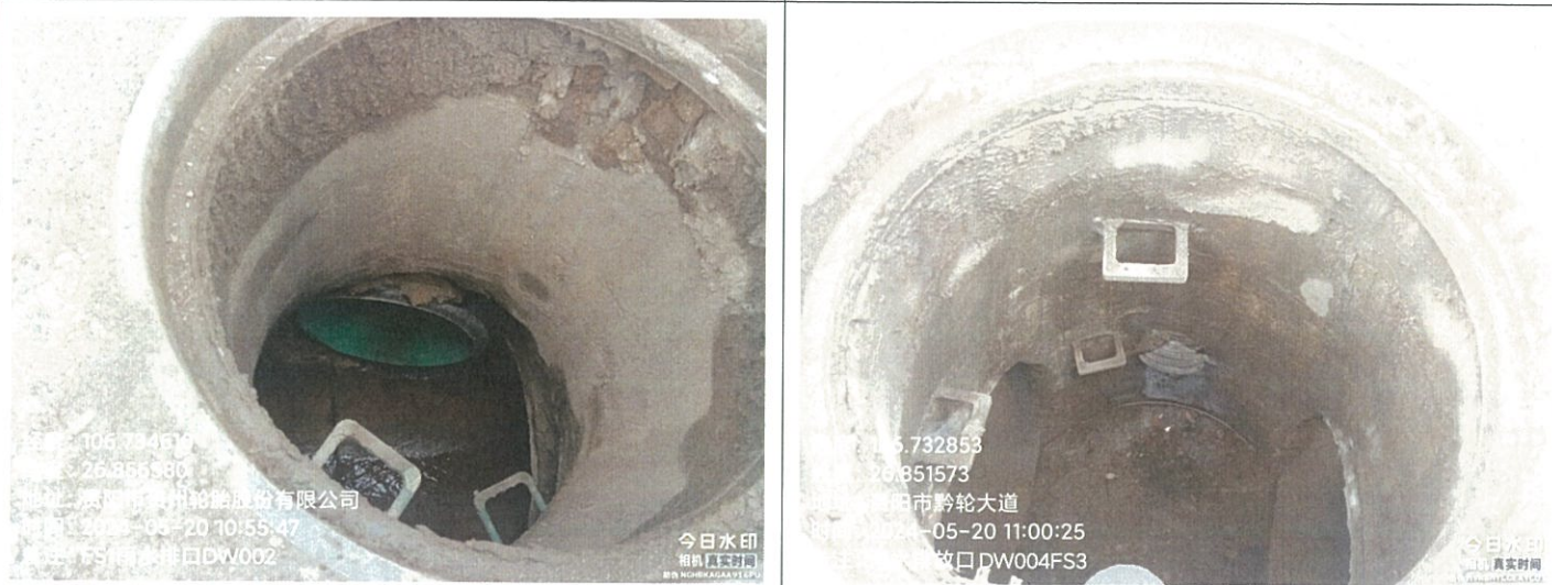
雨水排口 DW002FS1（无水） 雨水排口 DW004FS3（无水）